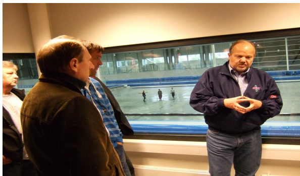
startere på Kretsplan

DA har også lagt til rett kurs som Norges Skøyteforbund har gjennomført i Sørmarka Arena og Rica Forum Hotell.